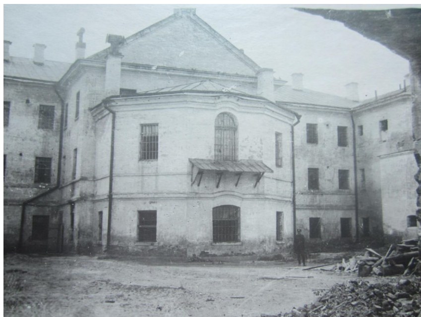
Рисунок. Апсида церкви Саратовской губернской тюрьмы (фото после 1917 г.)