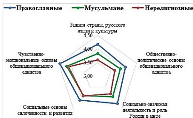
Рисунок 4. Конфессиональная вариативность в оценках российских ценностно-цивилизационных составляющих

сплочённости и развития говорят об их наибольшей важности для всех подгрупп респондентов. Оценки защиты страны, русского языка и культуры снижены в подгруппе нерелигиозных, для них меньшее значение имеют общественно-политические основы общенационального единства, социально значимая деятельность и роль России в мире (см. рис. 4).