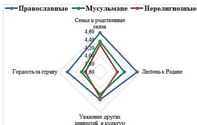
Рисунок 1. Конфессиональная вариативность оценок чувственно-эмоциональных основ общенационального единства

Однофакторный дисперсионный анализ не подтверждает наличия статистически значимых различий средней оценки чувственно-эмоциональных основ единства в зависимости от национальности ( F - 1,79 < F критического - 4,26 ). Выявлена разница в группе «вероисповедание» ( F - 6,10 > F критического - 4,26 ). Конфессиональный фактор ( R^2 - 57,5 \% ) превалирует над этническим ( R^2 - 28,5 \% ). Результаты теста Тьюки свидетельствуют о том, что имеется значимая разница в оценках православных и нерелигиозных (абсолютное среднее - 4,65 > Q критического - 3,2 ), православных и мусульман (абсолютное среднее - 3,77 > Q критического - 3,2 ). Оценки мусульман и нерелигиозных молодых людей значимо не различаются. Подтверждается наличие статистически значимых различий между средними оценками чувственно-эмоциональных основ общенационального единства православных и нерелигиозных, а также православных и мусульман, что подтверждает их относительную этническую инвариантность и конфессиональную вариативность (см. рис. 1).