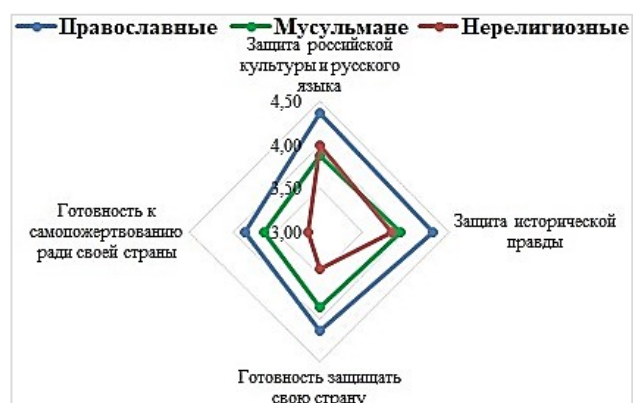
Рисунок 3. Конфессиональная вариативность оценок важности защиты страны, российской культуры, истории и русского языка

в мире (3,92 балла) и принадлежность к великой державе (3,91 балла). Она снижена в сознании нерелигиозных респондентов (см. табл. 4). Статистически значимые различия средних оценок в зависимости от национальности ( F - 2,22 < F критического – 4,26) и вероисповедания ( F - 4,22 < F критического – 4,26) не выявлены. Влияние конфессионального фактора ( R^2 - 48,4 \% ) выше этнического ( R^2 - 33,2 \% ).